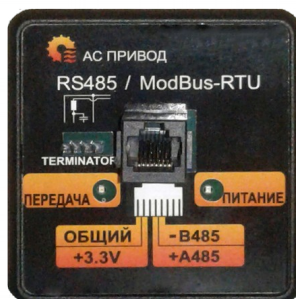
Рисунок 1. Вид панели, поддерживающей работу интерфейса RS485.

Подключение разрешено производить только при отключенном питании обоих устройств.